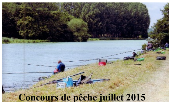
Concours de pêche juillet 2015

Dépositaires de cartes de pêche pour l'année 2016