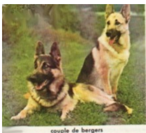
couple de bergers