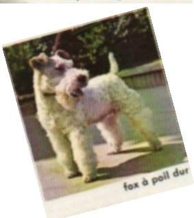
fox à poil dur