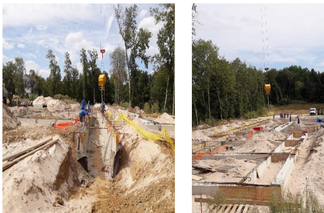
Le groupe scolaire sort peu à peu de terre