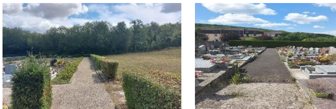
Le nettoyage des cimetières a repris